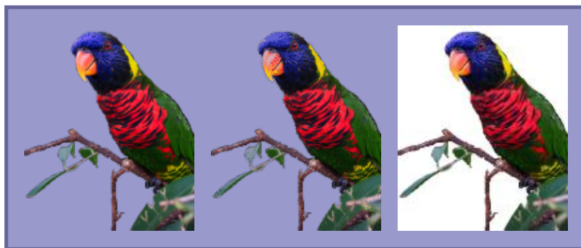
図 2 透過度情報を持つ PNG 画像の例。24-bit RGBA カラー (左、26K bytes) と 8-bit インデックス・カラー (中央、9.0K bytes)。8-bit インデックス・カラーへの変換には pngquant をもちいた。右は JPEG 形式で保存したもの (4.5K bytes)。画像は米 Kodak 社の ウェブ・サイト から入手可能なサンプル画像を加工したもの。