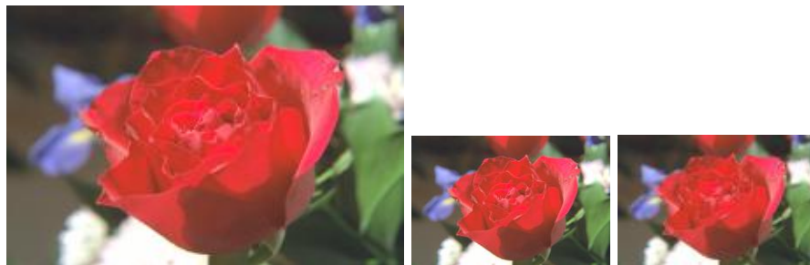
図 1 元の画像 (左、5.7K bytes) を 1/2 に縮小して表示させたもの (中央) とあらかじめ 1/2 に縮小しておいたもの (右、2.5K bytes)。この例では、Independent JPEG Group による JPEG ライブラリ配布物に含まれる testorig.jpg を使用した。

また、PDF バージョンを不必要に高く設定しない方が無難です。dvipdfmx は設定された PDF バージョンより高いバージョンを要求する PDF ファイルは取り込まないようになっています。目安として、文書中に日本語が使われている場合は PDF 1.2 (Acrobat 3) 以上に、和文 TrueType フォントを使用している場合は PDF 1.3 以上、グラデーション (shading) や透過色が使われているものは PDF 1.4 以上に設定します。タグつき PDF にはしないでください (未対応です)。基本的には、必要のない情報を書き出さずになるべく単純な PDF にしておくことと取り込みに成功する可能性が高くなります。